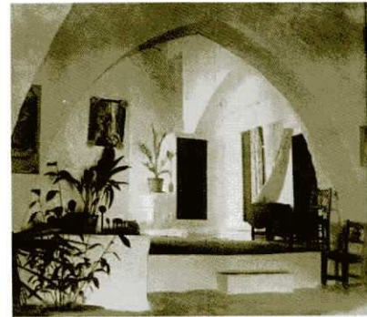
Aspecte de l'interior del Forn abans de la seua restauració.

A partir d'aquest moment són molt freqüents les notícies al·lusives a la reparació de l'olla d'ambdós forns en què es detallen els materials necessaris per a iniciar-hi les obres: calç, rajoles, argila i guix, i també posts de fusta per a fènyer la pasta . Això no obstant, els moments de manca afectaven de tal manera l'economia local que hi hagué anys en què els forns no pogueren ser llogats per l'absència de licitadors que acudiren a la subhasta. Així passà el 1532. Els anys següents, encara present la crisi, els lloguers es feren amb quantitats molt inferiors a les utilitzades anteriorment. Aquestes mesures tractaven de pal·liar les enormes pèrdues que la sequera i els fenòmens meteorològics ocasionaven indirectament en les rendes reials. En aquestes ocasions especials el temps d'arrendament es reduïa a un any, tot esperant, potser, que moments millors aconseguiren alçar els preus de les subhastes.