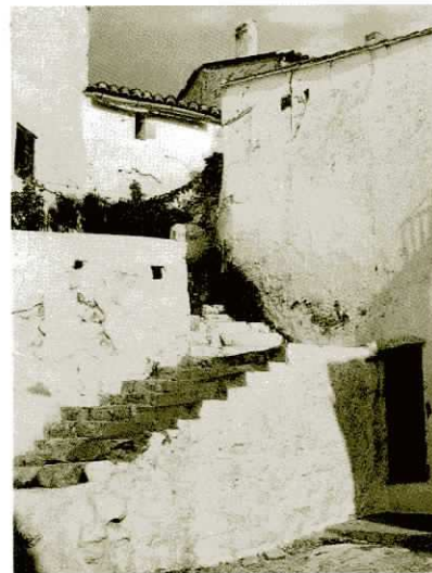
Façana del Forn que dona al carrer de la Sang.

Més tard, el 1933, després de l'inici de les excavacions al tossal de Sant Miquel, on aparegueren nombrosos testimonis de l'art iber, i a la vista de la importància de les troballes, es disposà la creació del museu, que finalment quedà resolt en una vitrina incorporada en un racó de la sala municipal de sessions del consistori.