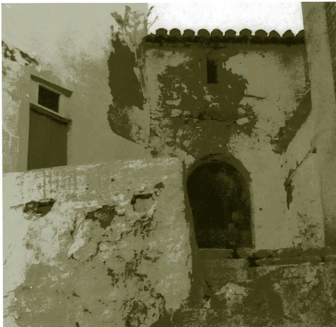
Façana del Forn.