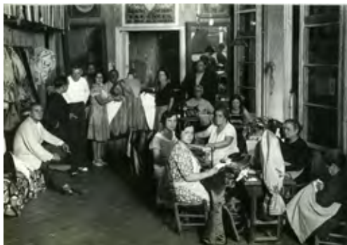
Retrat de grup al taller paper amb gelatina de plata