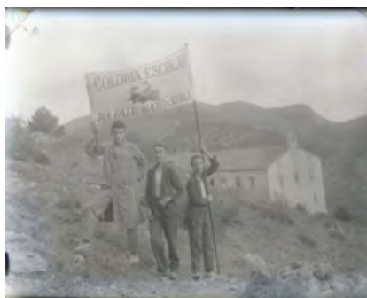
Grup de joves a la casa de La prunera a Serra Negatiu de vidre gelatin bromur 10x15

Nom: Patronato Juventud Obrera Codi: PJO