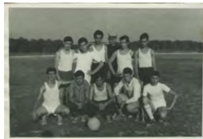
Retrat de grup esportiu paper amb gelatina de plata